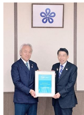
藏内会長と服部知事