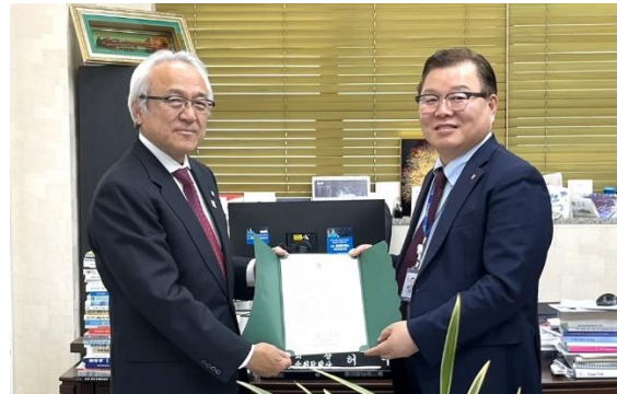
藏内会長とホ・ジュヒョン会長