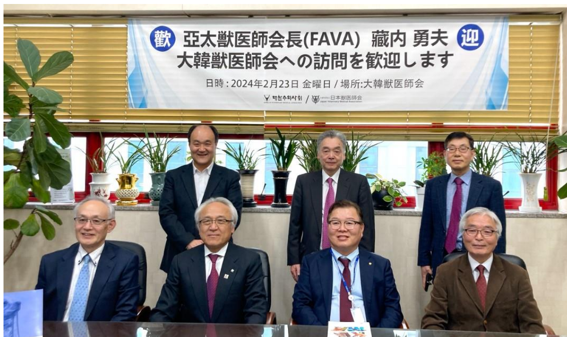
最所福岡県獣医師会会員