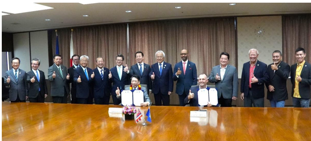
ジョシュ・グリーン知事